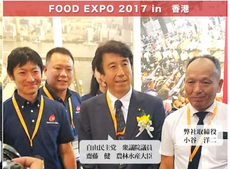
FOOD EXPO 2017 in 香港