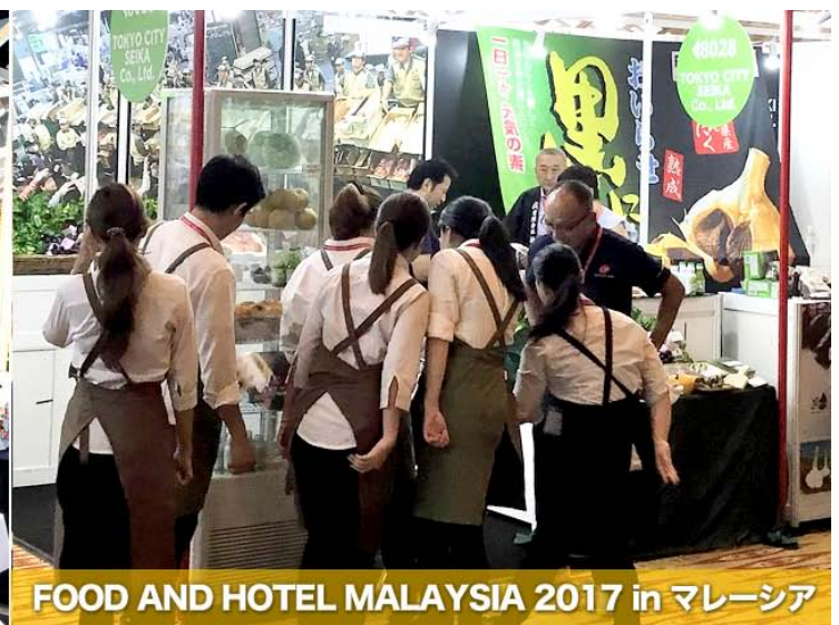
FOOD AND HOTEL MALAYSIA 2017 in マレーシア